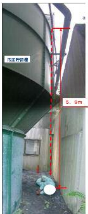
墜落時の様子（再現）