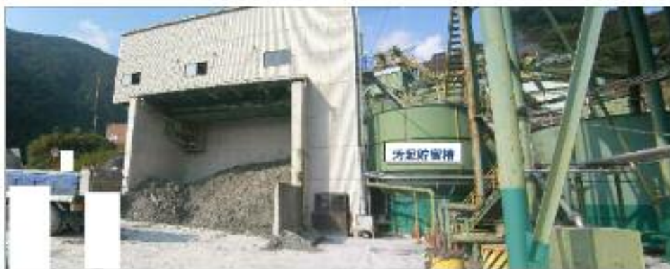
汚水処理施設正面