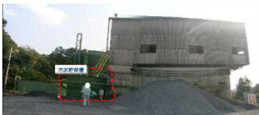
汚水処理施設裏側