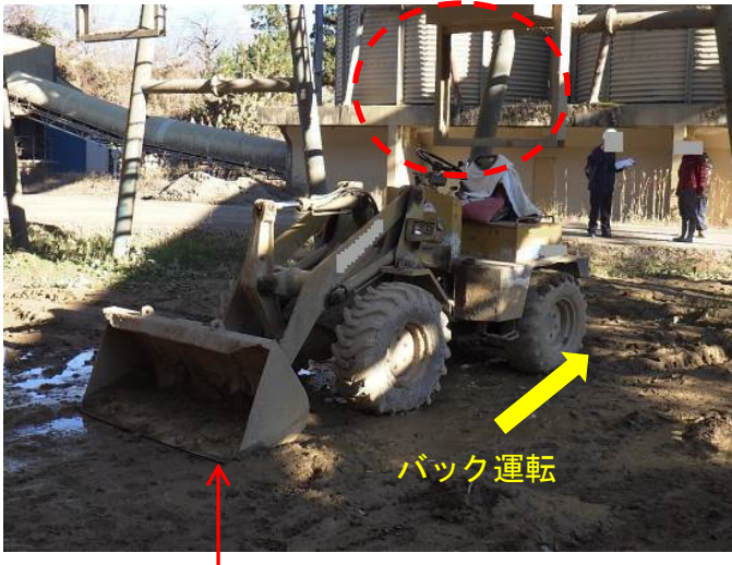
罹災者の使用していたミニローダー (キャビンやヘッドガード、バックミラー等がない)