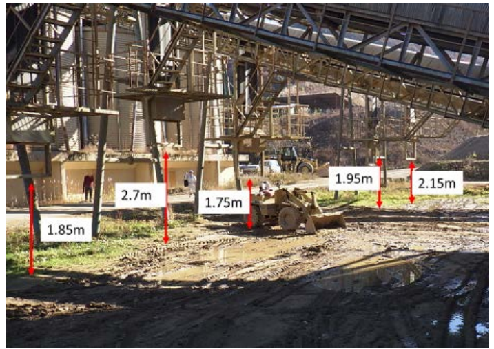
罹災箇所周囲にあるガイドアングルの高さ